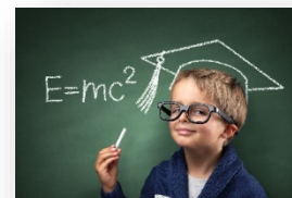
Évolution des taux de réussite aux ÉPREUVES MEQ mathématique de 6 e année

Finalement, nous remarquons une importante différence entre les taux de réussite aux résultats finaux et les taux de réussite aux épreuves ministérielles en mathématique également. Les taux aux épreuves ministérielles étant sous la barre des 80% sauf pour la compétence « Raisonner » en 2019.