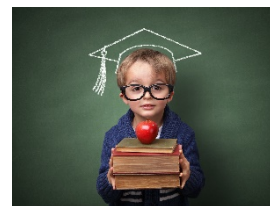
Évolution des taux de réussite aux ÉPREUVES MEQ LECTURE

Nous remarquons qu'il y a différence entre les taux de réussite des résultats finaux et ceux aux épreuves ministérielles. En effet, les taux aux résultats finaux étant plus élevés que ceux aux épreuves ministérielles en français.